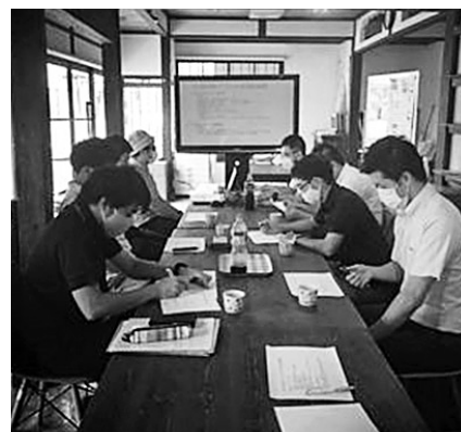
月1回開催している定例ミーティング